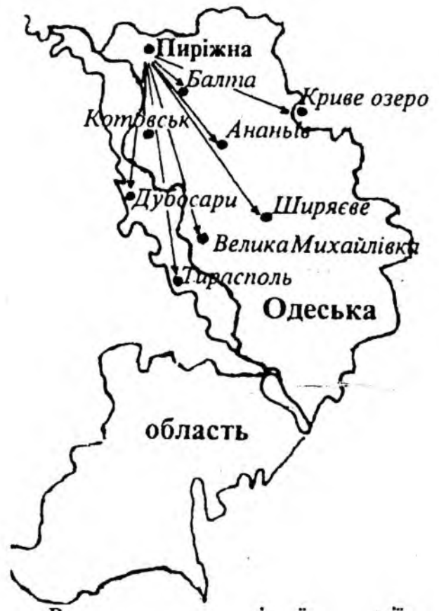
Ринки продажу керамічної продукції пиріжнянських гончарів.

дились у сфері впливу пиріжнянців. Постійні і тривалі контакти з населенням такого обширного регіону були надзвичайно корисними для майстрів. Вони враховували пропозиції і побажання, зважали навіть на магичні дії з боку покупців, виконували окремі побажання, не з'ясовуючи їх доцільності. Наприклад, жінки, купуючи глечик, своєю рукою заміряли висоту горла, від якої, на їхню думку, залежала товщина шару сметани. Тому гончарі намагалися вгадати бажані розміри. Іноді жінки просили майстра кинути в горщик власною рукою декілька соломинок. Гончарі виконували примхи замовниць здебільшого не цікавлячись, що б це означало.