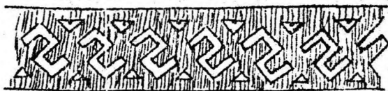
“Ламані хрести” (виконано чорною заповоччю на домотканому полотні, техніка - низь)

До першої групи можна віднести фрагменти, виконані на домотканому полотні нитками домашнього виробництва. Це, як правило, геометричні малюнки, виконані низкою досить